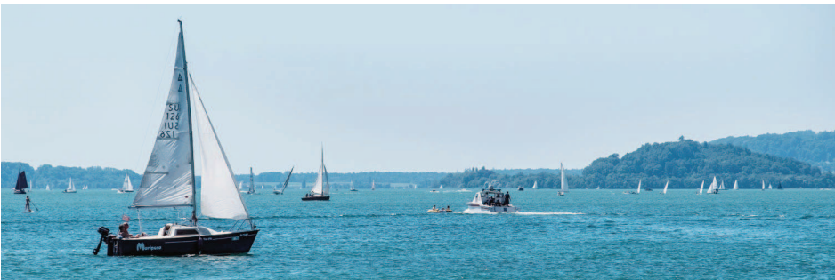
La météo s'annonce meilleure cette fin de semaine. De quoi donner de bonnes idées de baignade... P.YEVENETH

Musée d'histoire Rue des Musées 31, 032 484 00 88 www.mhcd.ch Ouvert: MA-DI 10h-17h.